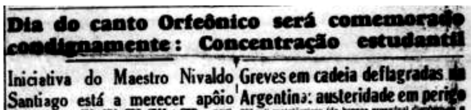
Figura 9: Dia do Canto Orfeônico.