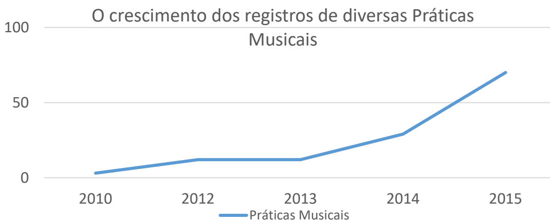
Gráfico 01: O crescimento dos registros de diversas Práticas Musicais

Os dados coletados pelos 18 grupos de alunos ao longo do desenvolvimento dessa experiência foram sistematizados em um quadro geral, com informações minuciosas e detalhadas, por duas mestrandas do Programa de Pós-Graduação em Artes da UFPA. Para este artigo, as informações foram dispostas em gráficos e conjuntamente comentadas.