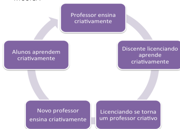
FIGURA 2: CICLO CRIATIVO DE FORMAÇÃO EM MÚSICA